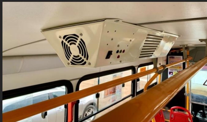
* Equipo instalado en autobús de 12 metros de largo.